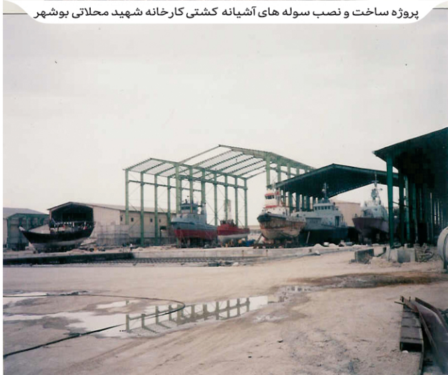
پروژه ساخت و نصب سوله های آتشیانه کشتی کارخانه شهید محلاتی بوشهر