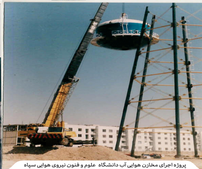
پروژه اجرای مخازن هوایی آب دانشگاه علوم و فنون نیروی هوایی سپاه