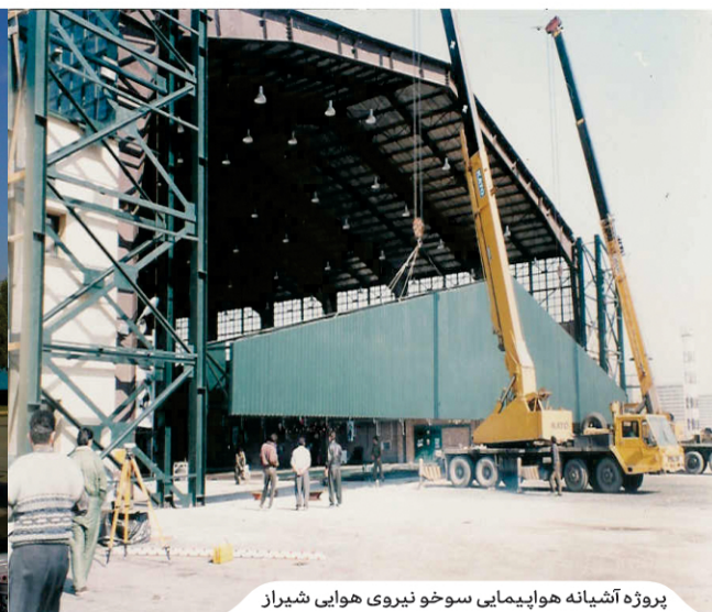
پروژه آتشیانه هواپیمایی سوخو نیروی هوایی شیراز